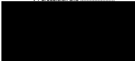
za Poskytovatele Eva Ceplová plná moc ze dne 1.3.2011