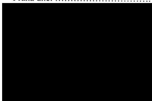
vedoucí Oddělení správy smluv Regionální pobočky Praha, pobočky pro Hl. m. Prahu a Středočeský kraj