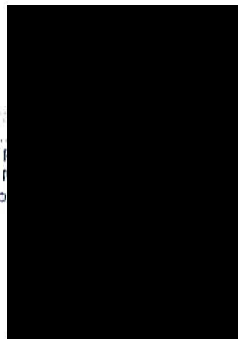
Za Ing. ředitel o