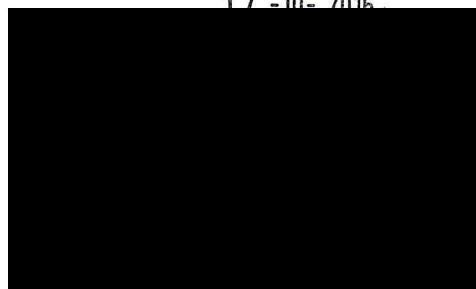
ředitel Regionální pobočky Brno, pobočky pro Jihomoravský kraj a Kraj Vysočina