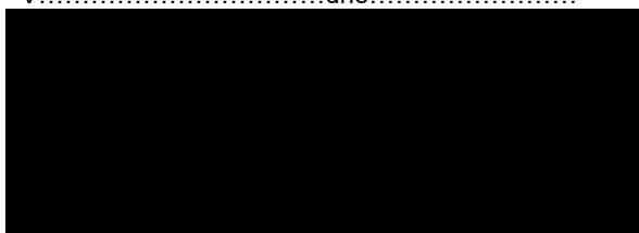
Za Poskytovatele MUDr. Šárka Navrátilová praktická lékařka pro dospělé