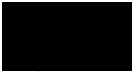
ředitel Regionální pobočky Hradec Králové, pobočky pro Královéhradecký a Pardubický kraj