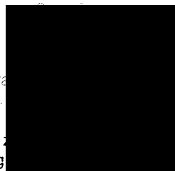
Ing. ředitel Odboru zdravotní péče Regionální pobočky Ostrava, pobočky pro Moravskoslezský, Olomoucký a Zlínský kraj