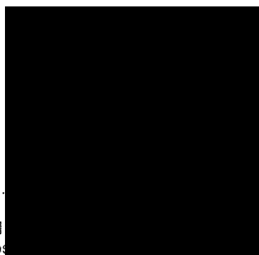
Michal Píkrýl, stních pos Regionální pobočka Praha, pobočka pro Hl.m.Prahu a Středočeský kraj